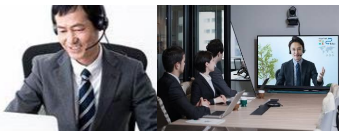
(左：当館小会議室、上の会議の写真はイメージです)